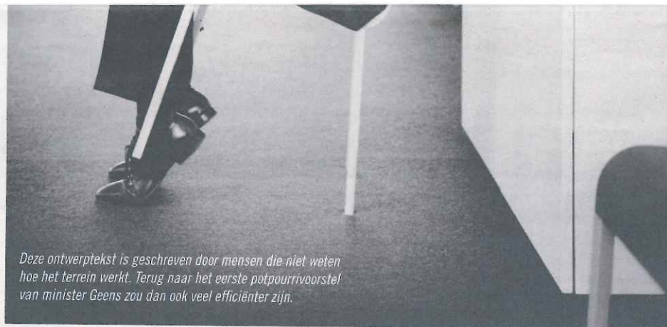
Deze ontwerp tekst is geschreven door mensen die niet weten hoe het terrein werkt. Terug naar het eerste potpourri voorstel van minister Geens zou dan ook veel efficiënter zijn.

Op vrijdag 8 mei 2015 passeerde het voorontwerp de ministerraad, nadat het voordien de ronde had gedaan op enkele kabinetten. De daardoor aangepaste tekst maakt van het bestaande consistente systeem een rommeltje, waardoor de verplichte mededeelbaarheid in sociale zaken losgekoppeld wordt van de huidige opvolging door het auditoraat. De tussenkomst van het openbaar ministerie kan nog verder gebeuren via een vraag van de rechter of via een omzendbrief van de minister. Na advies van het College van procureurs-generaal kan de minister richtlijnen bepalen die door het arbeidsauditoraat en arbeidsauditoraat-generaal uitgevoerd moeten worden. De minister komt zo rechtstreeks tussen in burgerlijke procedures en doorbreekt de scheiding der machten. Dat is een ongrondwettelijk achterpoortje, dat niet aanvaard kan worden.